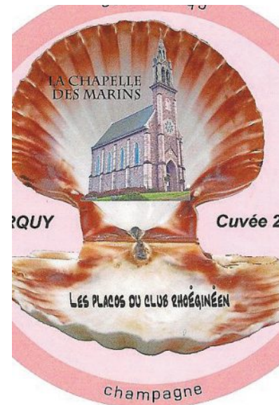
Les visiteurs de la bourse des collectionneurs pourront découvrir, dimanche, la nouvelle capsule.

Une bourse multicollections qui attire de plus en plus d'exposants. « 33 tables sont prévues. Les gens viennent de Nantes, Brest ou Angers, on refuse du monde. »