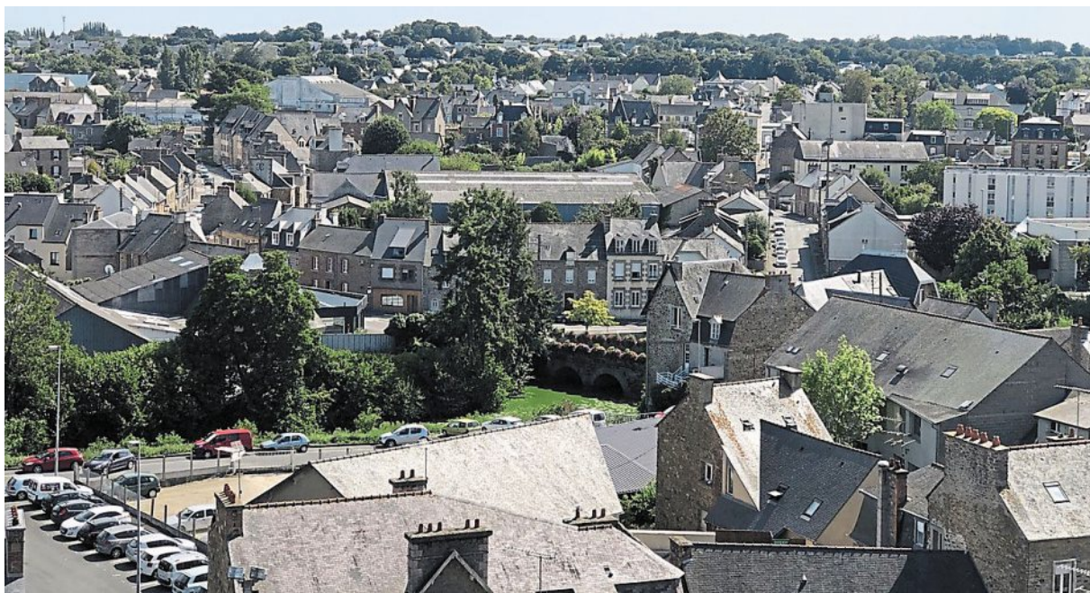
Lamballe reste une ville attractive. « Ça fait deux ans que le marché est porteur. Mais, c'est un équilibre qu'il faut maintenir », note une notaire.